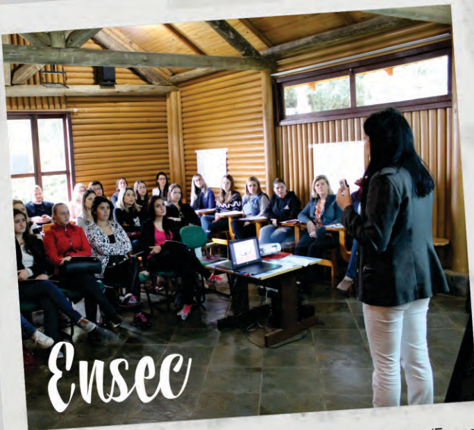
O Encontro de Secretárias, Recepcionistas e Atendentes (Ensec), contou com um espaço agradável e uma programação diferenciada. A iniciática contou com socialização e conhecimento