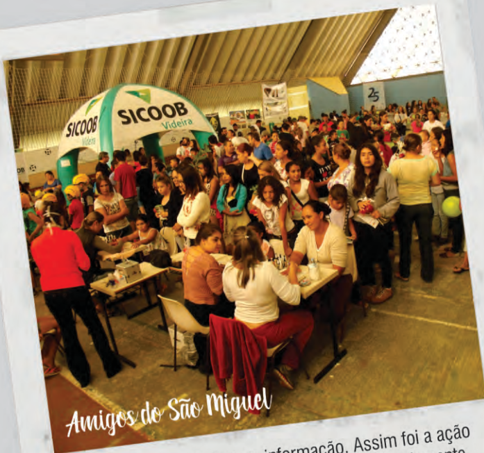
Amigos do São Miguel

Uma tarde de solidariedade e informação. Assim foi a ação social Amigos do São Miguel que reuniu aproximadamente cinco mil pessoas no bairro na 2ª edição do evento.