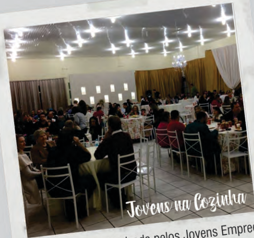
A promoção organizada pelos Jovens Empreendedores contou com mais de 200 pessoas saboreando o Yakisoba preparado pelos mesmos