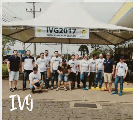
A Inspeção Veicular Gratuita (IVG) realizada pelo Núcleo de Auto Reparadores da ACIAF contou com 52 veículos inspecionados pelo rol de mecânicos capacitados, integrantes do Núcleo.