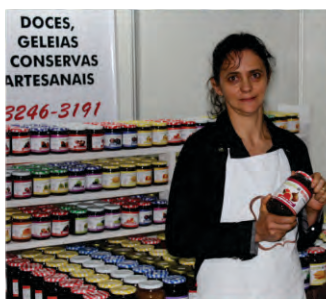
Feira da Agricultura Familiar contou com comércio de diversos itens