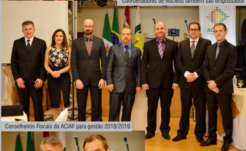
Conselheiros Fiscais da ACIAF para gestão 2018/2019