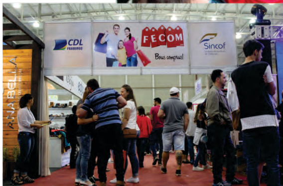
Feira do Comércio Lojista contou com descontos em diversas mercadorias