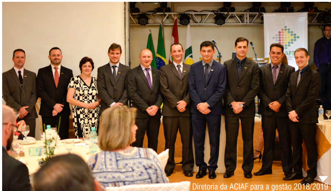
Diretoria da ACIAF para a gestão 2018/2019

Evento que marcou posse da diretoria da ACIAF foi realizado no Hotel Renar com grande público prestigiando.