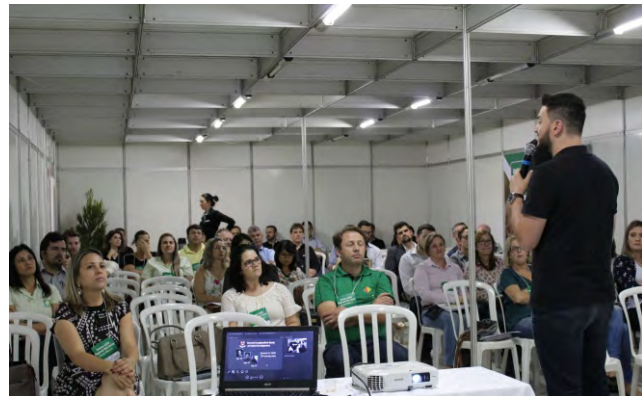
Mais de 30 espaços de capacitação foram disponibilizados gratuitamente

A Expo ACIAF 2018 foi uma realização da Associação Empresarial de Fraiburgo (ACIAF), com o apoio da Prefeitura Municipal de Fraiburgo, Epagri e CDL Fraiburgo. O evento ainda teve o patrocínio da Fiesc e Uniarp.