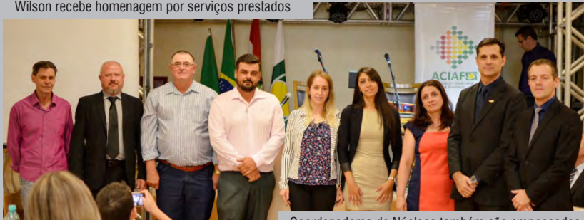
Coordenadores de Núcleos também são empossados