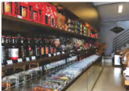
Prateleira com variado mix de produtos na Chocolate Lugano, em Fraiburgo

Brasileiro de Micros e Pequenas Empresas), que aponta os baixos riscos no investimento em franquias. Segundo a informação do Sebrae, o índice de falência das franquias nos cinco primeiros anos de existência é de menos de 15%, enquanto que de micro e