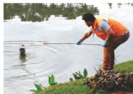
Os pontos de coletas são fixos, para que haja monitoramento mensal