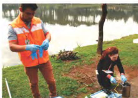
Técnicos do Laboratório Terranálises no momento da coleta

empresa e, por meio de uma parceria tanto com a Universidade, quanto com o Município de Fraiburgo, o mesmo pôde ser executado. “Sem dúvida é um projeto de extrema importância para o nosso município, onde toda a sociedade terá conhecimento da atual situação da qualidade da água do lago e, juntamente com poder público e instituições privadas, poderá ser desenvolvido um plano para a preservação e melhoria da qualidade da água deste belo cartão postal da cidade de Fraiburgo. Estamos muito honrados em poder estar desenvolvendo esse trabalho de forma voluntária, pois o mesmo vem ao