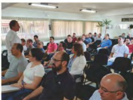
Programa conta com professores da FGV, dividido em 8 módulos, durante 8 meses

Com um corpo docente altamente qualificado, com professores com conhecimento e experiência no