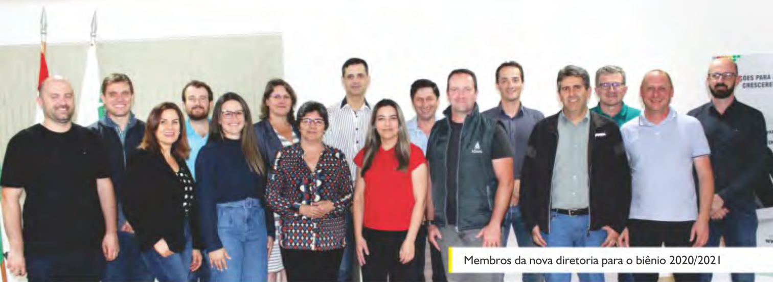
Membros da nova diretoria para o biênio 2020/2021