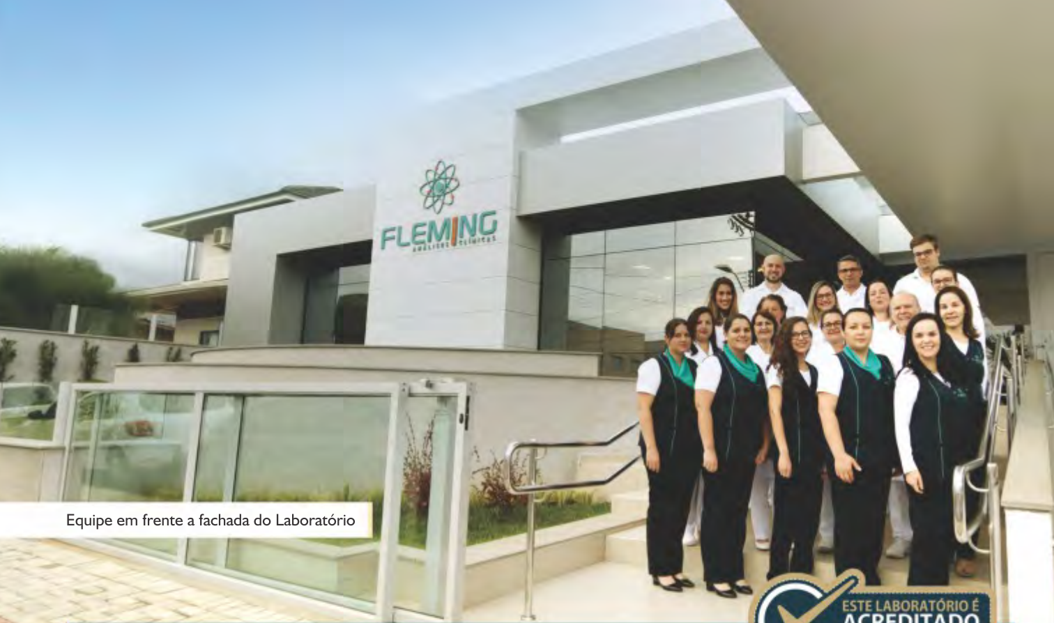
Equipe em frente a fachada do Laboratório