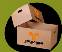
Caixas de Papelão