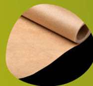
Papel Kraft e reciclado

São as mais diversas possibilidades de embalagens de papelão ondulado confeccionadas para atender o mercado.