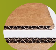
Chapas de Papelão Ondulado