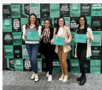
Secretária executiva da Aciarf presente no Seminário ONE da Facisc Link https://portal.aciarf.com.br/secretaria-executiva-da-aciarf-presente-no-seminario-one-da-facisc/