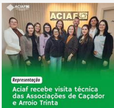
Representação Aciarf recebe visita técnica das Associações de Caçador e Arroio Trinta