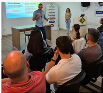
20 DE AGOSTO DE 2024 | 0 MENUS COMENTÁRIOS Ciclo de Palestra fala sobre Marketing e Redes Sociais

Diversos cursos de capacitação são desenvolvidos de forma gratuita na associação.