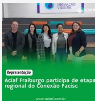
Representação Aciarf Fraiburgo participa de etapa regional do Conexão Facisc www.aciarf.com.br Link https://www.instagram.com/p/C8mMmMHpJ5B/?img_index=1