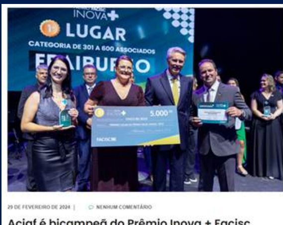
Aciaf é bicampeã do Prêmio Inova + Facisc

Prova do nosso compromisso foi a premiação pelo segundo ano consecutivo no prêmio Inova+.