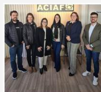
Aciarf recebe visita de benchmarking da ACIOC Joaçaba

Links https://www.instagram.com/p/C9Be5m0tyto/?img_index=1 https://www.instagram.com/p/C7PxWAhPjj2/