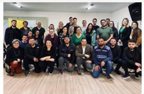
31 DE JULHO DE 2024 | 0 MENUS COMENTÁRIOS Trilha do Empreendedor capacita jovens empresários

link https://www.instagram.com/p/C-2-lbGvxLM/