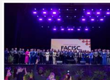
ACIAF tem cadeira nas diretorias da Facisc e Fundação Empreender Link https://portal.aciarf.com.br/aciarf-tem-cadeira-nas-diretorias-da-facisc-e-fundacao-empreender/