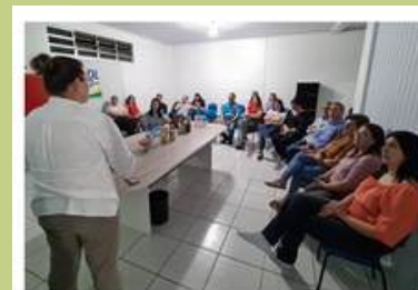
ACIAF faz entrega da Cartilha Voz Única em Monte Carlo