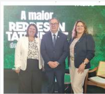
Aciarf participa de Facisc Day Link https://www.instagram.com/p/C9KMT-HprSv/

A parceria é reforçada no compromisso da ACIAF com a FACISC, participamos de diversas ações da instituição este ano.