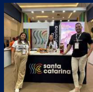
Participação da FIT Cataratas