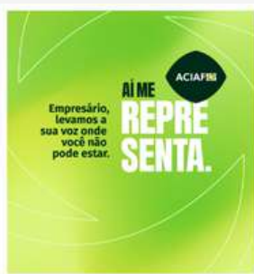
FACISC reforça representatividade do setor produtivo catarinense Link https://www.instagram.com/p/C9KMT-Hpr5v/

A associação faz o papel de união entre o poder público e o privado. Levando as demandas e participando ativamente dos processos de tomada de decisão nos mais diversos comitês do qual faz parte. Prezamos as parcerias público-privadas em prol do desenvolvimento regional. A parceria é reforçada no compromisso da ACIAF com a FACISC, participamos de diversas ações da instituição este ano.