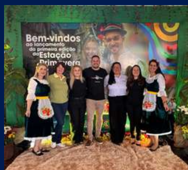
Participação no evento Estação Primavera