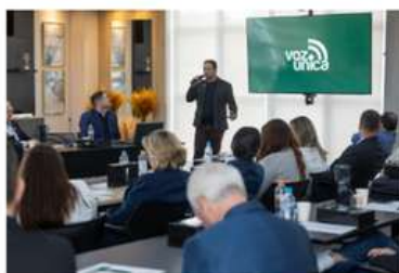
Facisc lança Voz Única 2026 com novidades para definição das necessidades de todo o estado https://portal.aciaf.com.br/facisc-lanca-voz-unica-2026-com-novidades-para-definicao-das-necessidades-de-todo-o-estado/