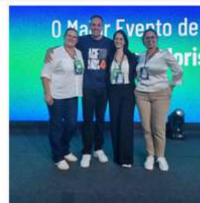
ACIAF participa de Facisc Day https://portal.aciaf.com.br/aciaf-participa-de-facisc-day-2/