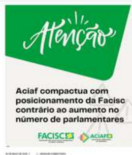
ACIAF compactua com posicionamento da Facisc sobre aumento no número de parlamentares https://portal.aciaf.com.br/aciaf-compactua-com-posicionamento-da-facisc-sobre-aumento-no-numero-de-parlamentares/