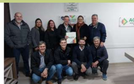
Painel Executivo conta com a presença do prefeito de Fraiburgo https://portal.aciaf.com.br/painel-executivo-counta-com-a-presenca-do-prefeito-se-fraiburgo/

Buscamos manter sempre o contato com o governo municipal acompanhando os trabalhos e realizando a cobranças das demandas ligadas a cartilha Voz Única municipal, em 2025 o prefeito municipal de Fraiburgo foi convidado para participar de uma reunião com a diretoria para apresentação dos trabalhos realizados.