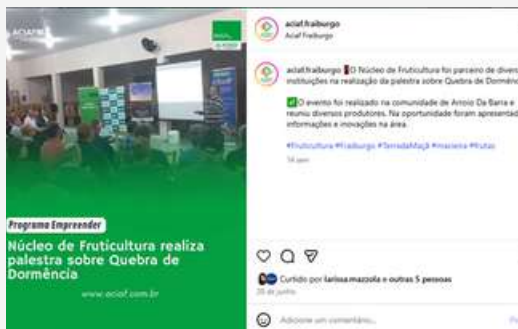
Atividade do núcleo de fruticultura https://www.instagram.com/p/DLLaChYggyn/

A associação apoia a agricultura familiar e sustentável, sendo que seu núcleo de fruticultura desenvolve diversas ações que visam o aumento de produtividade das propriedades.